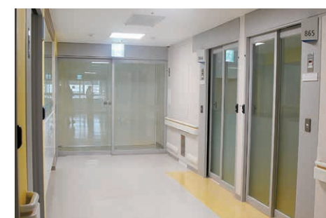
▲ 인천세종병원 8층에 마련된 긴급치료병상

인천세종병원 긴급치료병상은 총 16개 음압병실로 구성되어 있으며, 환자 모니터링이 가능한 간호스테이션을 갖추고, 비밀 차단을 위해 전면에 아크릴 가림막을 설치했다. 아울러 안정적인 음압 기능을 위해 밀폐형 구조