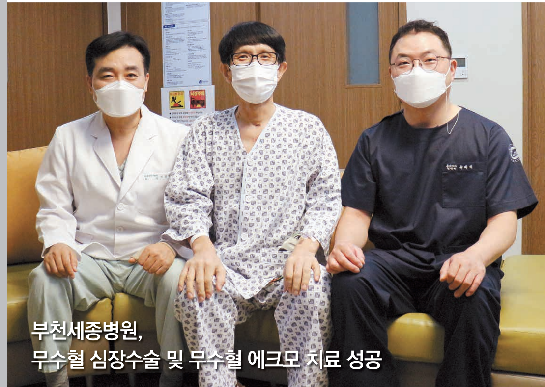
부천세종병원, 무수혈 심장수술 및 무수혈 에크모 치료 성공