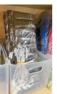
▲ 입원환자를 위해 제공되는 일회용 속옷

을 탈의한 후, 신체 노출 등으로 인한 수치감이 들지 않도록 일회용 속옷을 전달하고 있으며, 이를 착용한 후, 시술 수술 시에는 가위 등을 이용하여 바로 제거할 수 있도록 하고 있다.